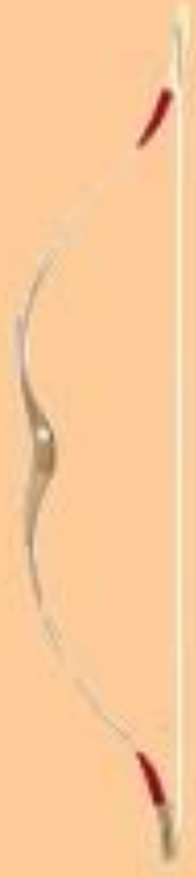
Falke II (hunnisch, asymmetrisch)

Sehnenlänge: 138 cm Zugstärke: 25-65# Auszugslänge: 32"