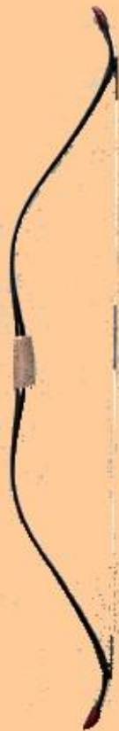
Wind Traditional Fighter (koreanisch)

Sehnenlänge: 117 cm Zugstärke: 20-55# Auszugslänge: 31"