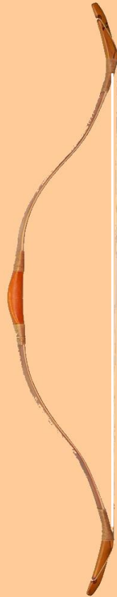
Türke Bio Composite

Sehnenlänge: 138 cm Zugstärke: 25-65# Auszugslänge: 32"