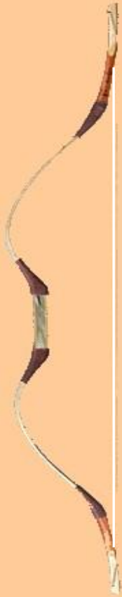
Hunne Extra I (asymmetrisch)

Sehnenlänge: 141 cm Zugstärke: 25-80# Auszugslänge: 31"